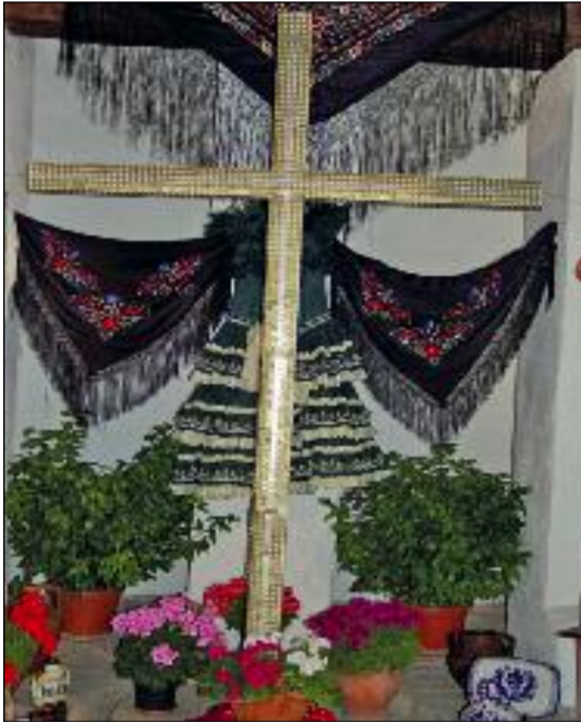
Cruz de mayo en Mondújar Lecrín, decorada con 6000 antiguas pesetas rubias y 1500 pesetas blancas.