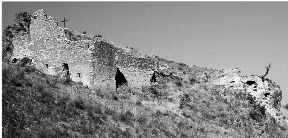
El castillo de Mondújar.