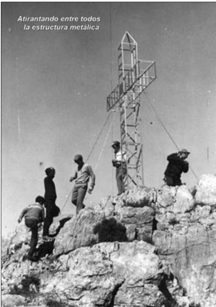
Atirantando entre todos la estructura metálica