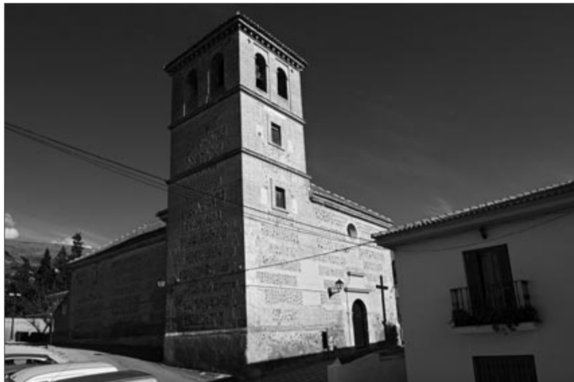
Iglesia de San Juan Bautista (Mondújar)