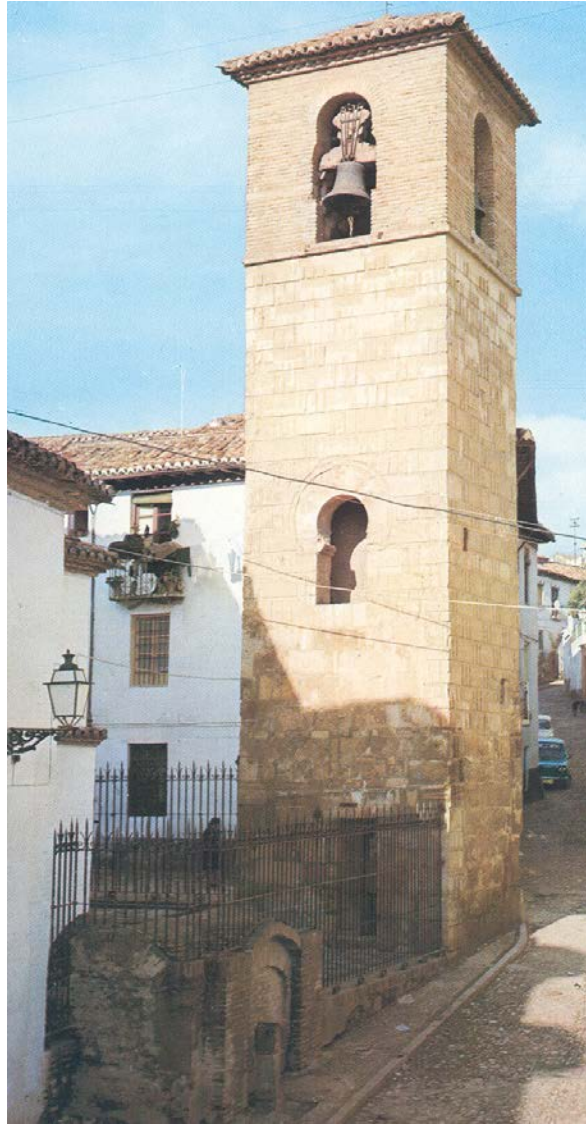
Alminar de la Iglesia de San José de Granada