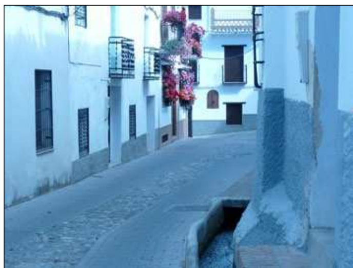
Barrio de la Cruz

Un elemento que fue principal en la organización y disposición de los distintos distritos de Nigüelas